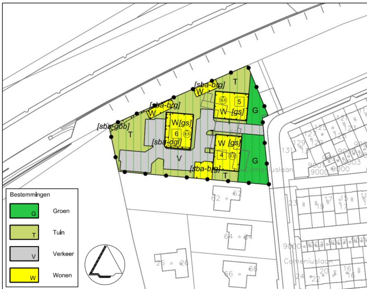
Figuur 1: Uitsnede plankaart