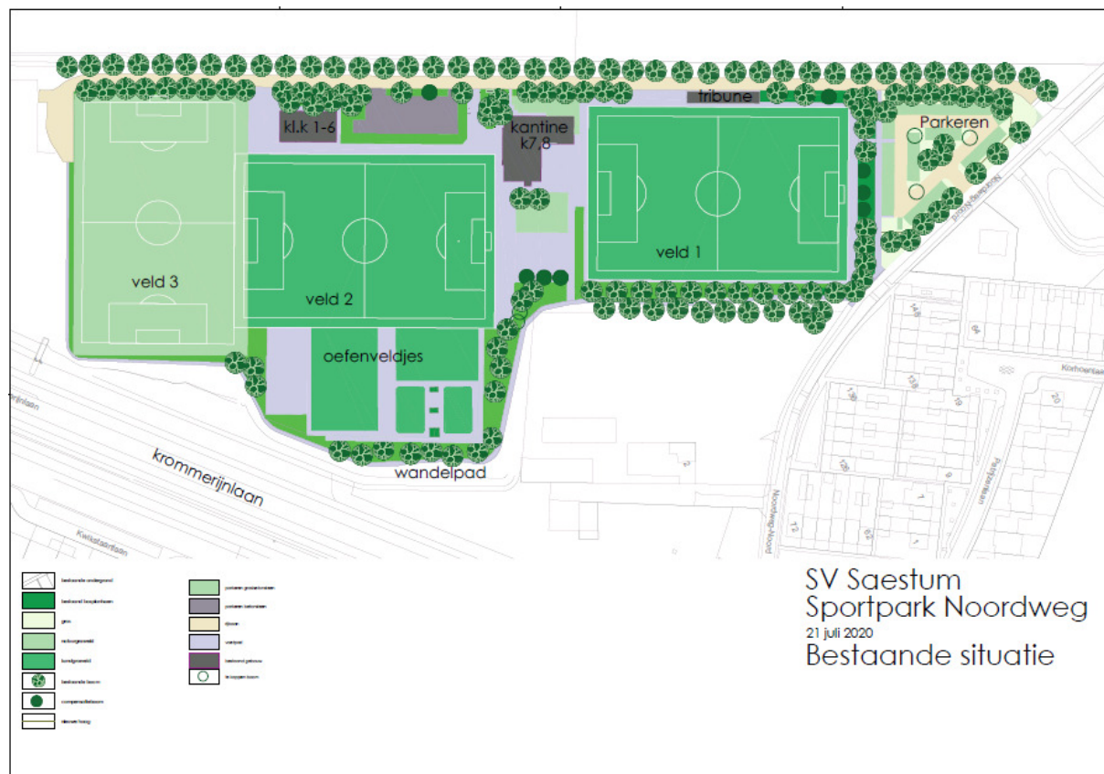
Huidige situatie sportpark Noordweg