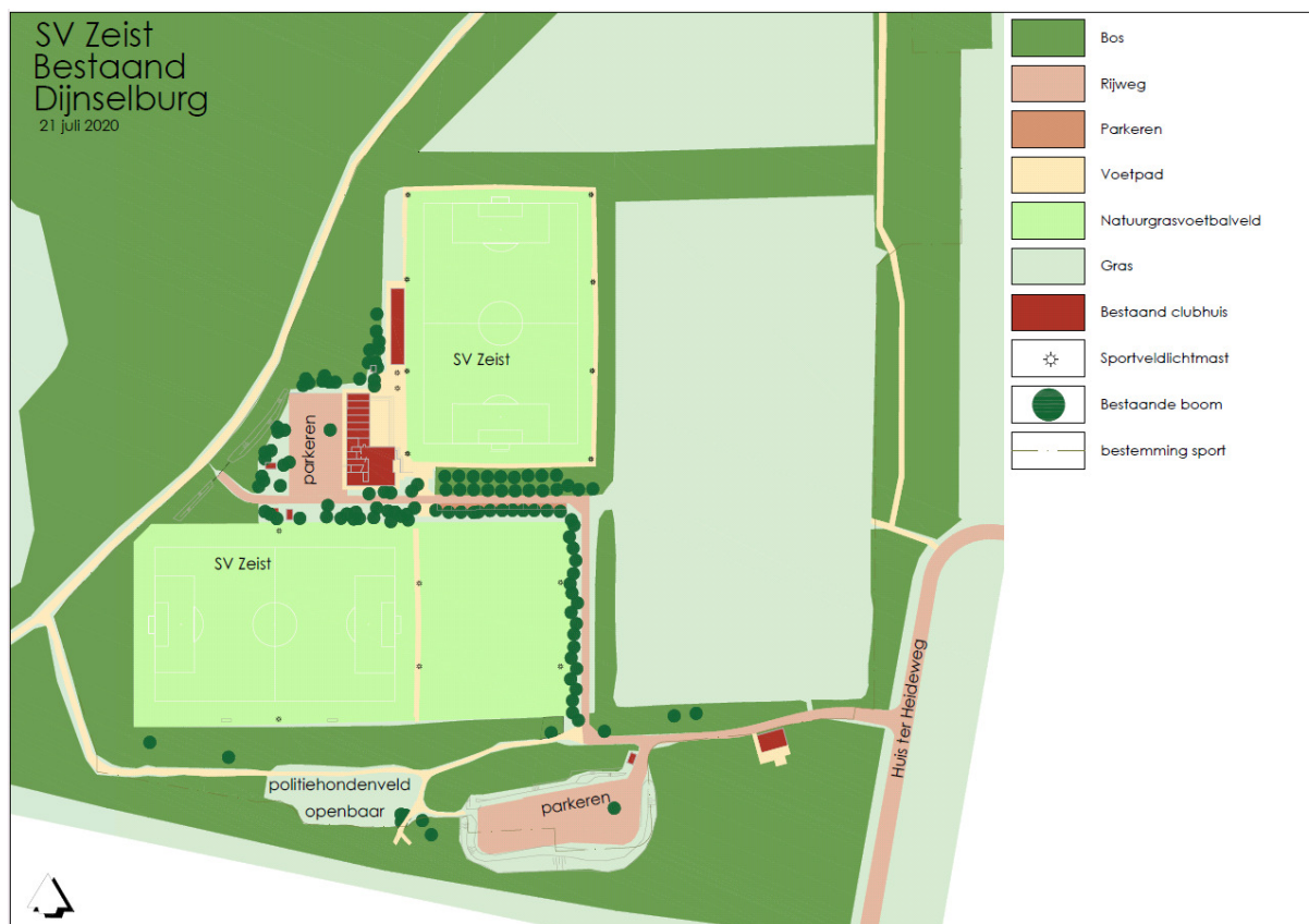
Huidige situatie sportpark Dijnseburg