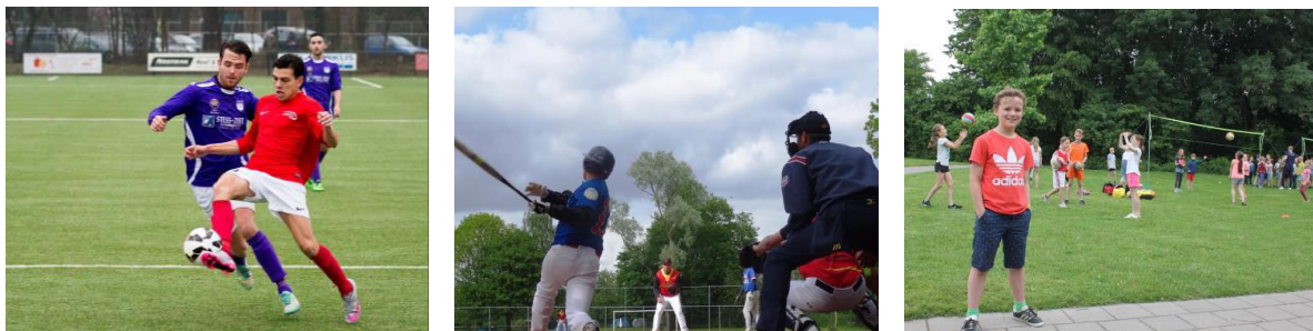
Referentiebeelden gebruik sportpark en openbaar gebruik