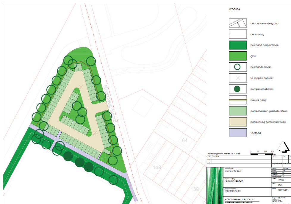
Nieuwe situatie parkeerterrein Noordweg-Noord

Daarnaast is er ook een concept inrichtingsschets gemaakt voor een nieuwe indeling van het parkeerterrein, waarbij we door een efficiëntieslag het aantal plekken uit kunnen breiden van 56 naar 67 parkeerplaatsen. Daarnaast kan door een herinrichting van de parkeerplaatsen eindelijk iets gedaan worden aan de minder sociaal veilige situatie ter plaatse (veel hangproblematiek, drugshandelingen etc.). Het betreft derhalve zowel een upgrade voor de vereniging als ook voor de omwonenden en omliggende bedrijven die allemaal veel hinder van de ongewenste activiteiten op het parkeerterrein ondervinden.