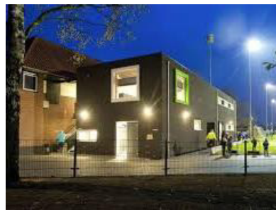
Referentiebeelden aanbouw kleedkamers en verbeteren parkeren